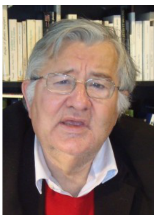
Jean Marie Pelt président de l'Institut européen d'écologie

Extrait du livre de Jean Marie Pelt Les dons précieux de la nature Editeur : J'ai lu page 53